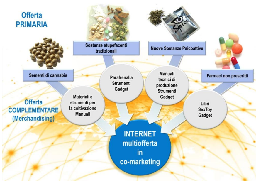
Figura 28 – Sviluppo dell'e-commerce e convergenza delle varie offerte e dei mercati illegali in Internet (co-marketing).

La figura successiva riassume in concetti qui esposti.