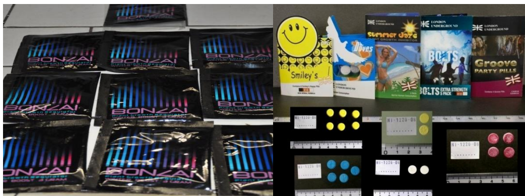
Figura 27 - Immagine di alcuni prodotti venduti anche via Internet.

Tutti questi siti, nella loro diversificata tipologia, sono generati e gestiti da una moltitudine di "agenti", molto spesso singole persone o nuove organizzazioni che non fanno parte delle tradizionali organizzazioni criminali dedite al traffico e allo spaccio delle sostanze stupefacenti già note. Da segnalare anche l'alto turnover di questi siti che una volta individuati e posti sotto controlli o chiusi per azione della Polizia Giudiziaria, rinascono dopo pochi giorni, con altre sembianze, su altri server.