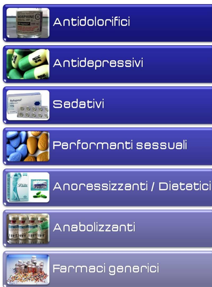
Figura 29 – Farmacie online (farmaci offerti senza prescrizione medica)

In Italia, l'agenzia che si occupa del monitoraggio e del controllo delle farmacie online è l'Agenzia Italiana del Farmaco (AIFA). Secondo tale agenzia, il fenomeno della contraffazione farmaceutica, intendendo per contraffatto "un farmaco la cui etichettatura è stata deliberatamente preparata con informazioni ingannevoli in relazione al contenuto e alla fonte" (definizione dell'Organizzazione Mondiale della